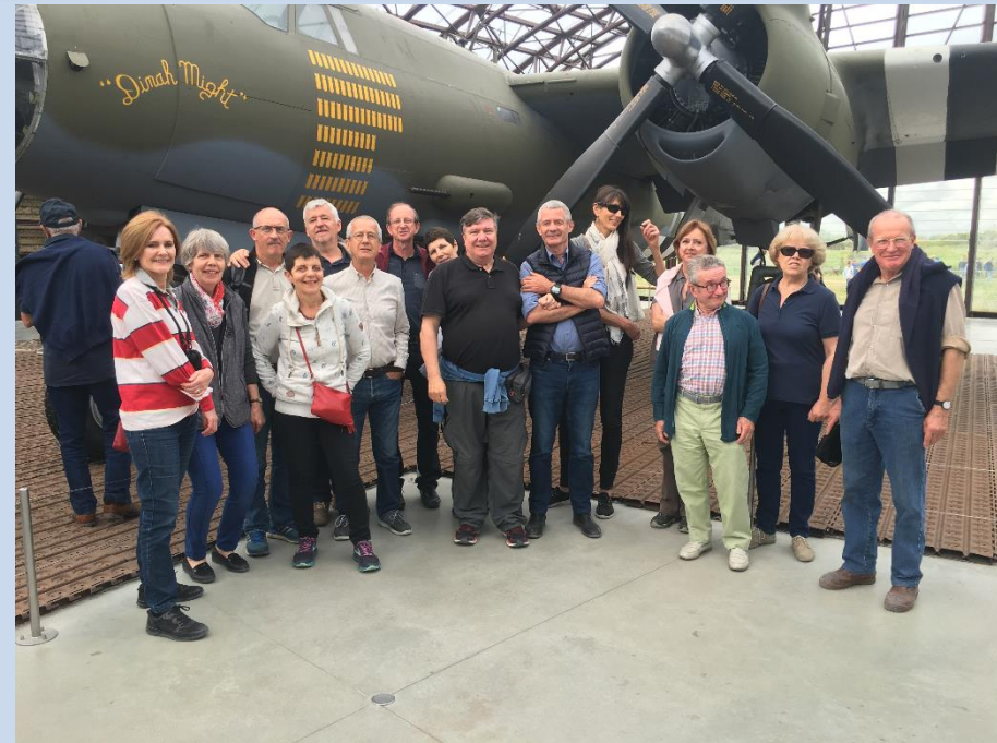
Week-end en Normandie de la T1971