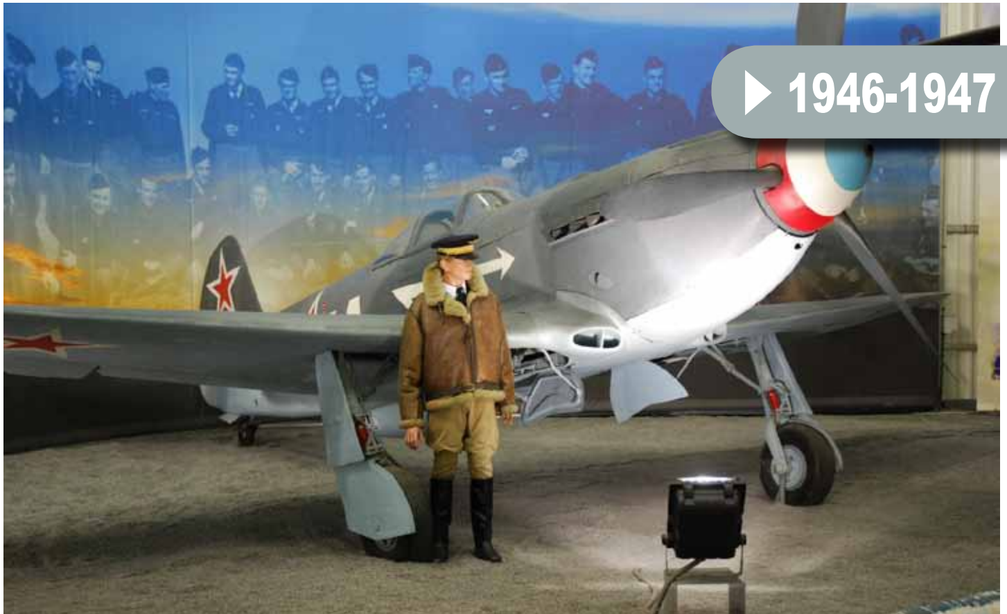
Musée de l'Air et de l'Espace (Le Bourget)